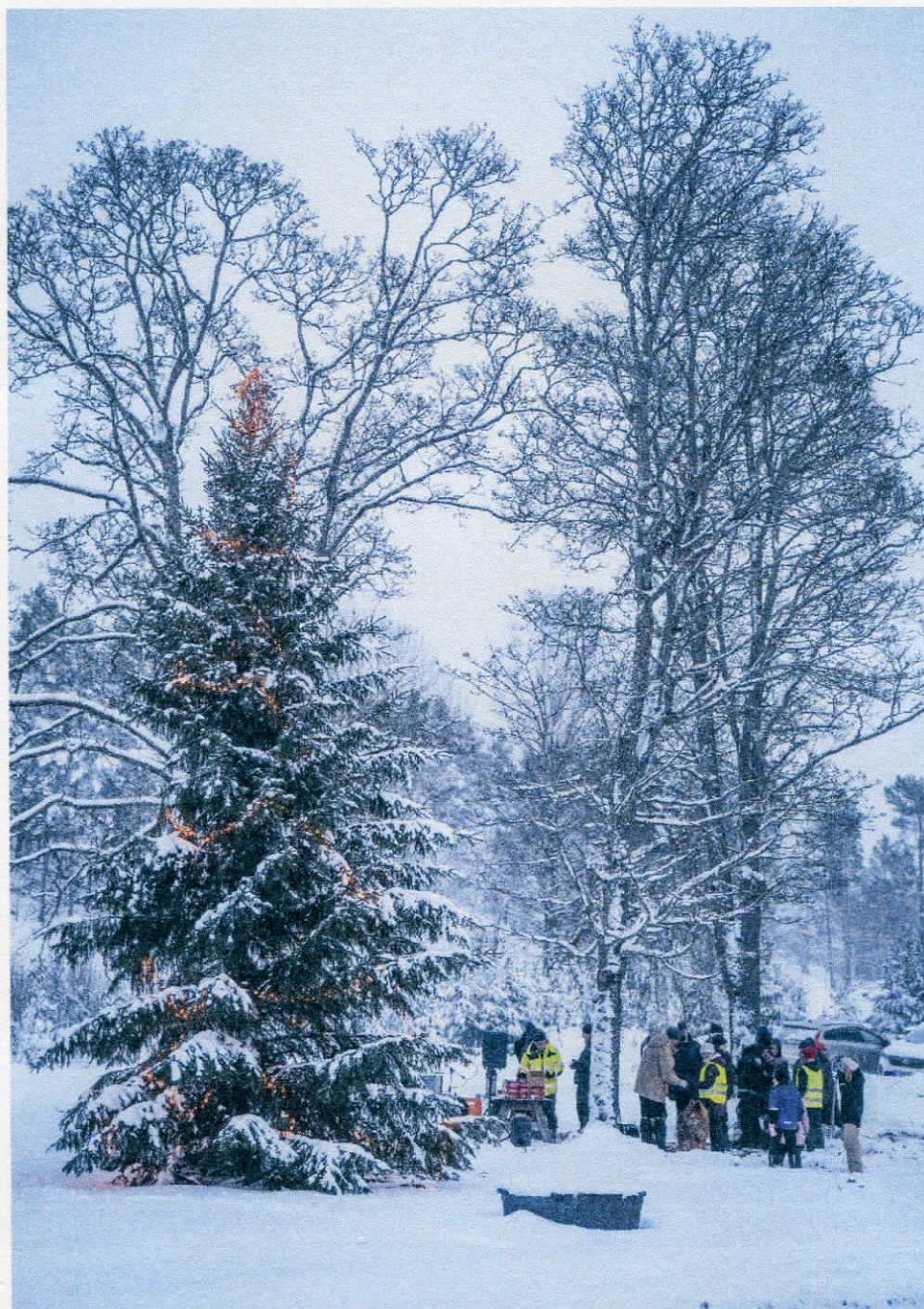
Bild från Julgranständningen första advent 3 december 2023.